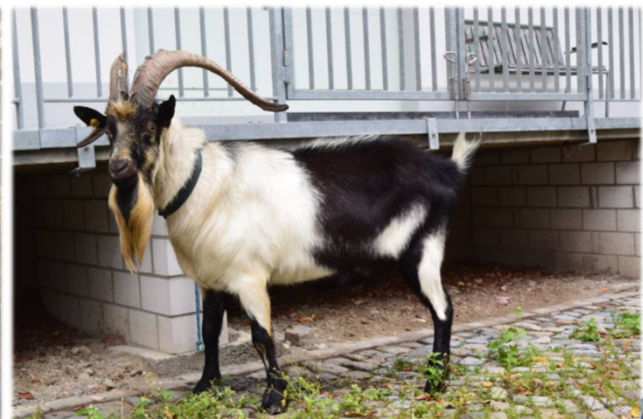
«Alter Strickhof», CH

Schweizerischer Ziegenzuchtverband SZZV | Fédération suisse d'élevage caprin FSEC | Federazione svizzera allevamento caprino FSAC | Federaziun svizra d'allevament da chauras FSAC